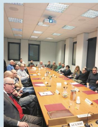
Una delle riunioni del Gruppo Govi