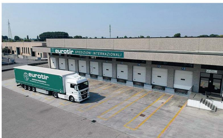
Imponente il parco veicoli, diversificati e adatti a ogni volume di spedizione, tutti dotati di sistema satellitare

L'impresa mantovana di trasporti internazionali ha le competenze e il know-how per occuparsi, con la stessa qualità, passione e impegno, anche di operazioni doganali disponendo di un ufficio doganale interno; I servizi doganali sono fondamentali per le aziende che esportano i loro prodotti all'estero e devono sbrigare la documentazione necessaria senza subire ritardi o perdite economiche. Inoltre, Eurotir è autorizzata dall'Agenzia delle Dogane ad espletare formalità e processi sia import che export offrendo un servizio di deposito doganale in conto terzi presso il proprio magazzino di Castel Goffredo, che consente l'immagazzinamento di merce non comunitaria, per periodi più o meno lunghi, senza che tale merce sia soggetta al versamento immediato di dazi e IVA. Questi pagamenti vengono posticipati al momento della vendita della merce, anche parziale, da parte del cliente. L'obiettivo dell'azienda è quello di fornire non solo un servizio di spedizione ma anche una consulenza operativa, commerciale e assicurativa per poter risolvere le varie e complesse problematiche di logistica delle aziende. Eurotir presta particolare attenzione alle esigenze del cliente e punta a fornirgli un servizio che trovi il giu-