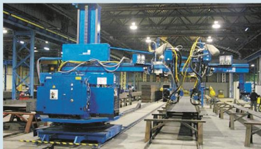
Nelle foto in pagina alcuni dei cantieri e dei lavori di Enertech

“La nostra sfida per il futuro è l'estero”