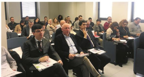
I partecipanti al seminario presso il polo formativo di Apindustria

GRANDE SUCCESSO DEL SEMINARIO DI APPROFONDIMENTO