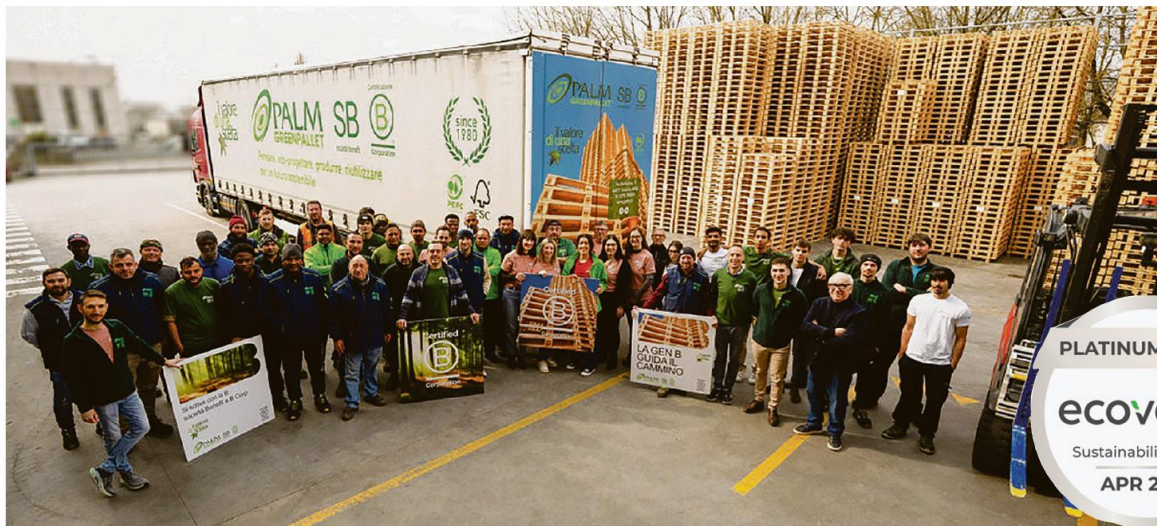
La grande famiglia della Palm ha raggiunto l'ennesimo e prestigioso traguardo nel campo della sostenibilità aziendale