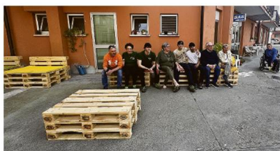
Palm protagonista anche nel mondo del sociale, come dimostra la recente collaborazione con la Fondazione Busi di Casalmaggiore (foto sopra e a destra). Nelle scorse settimane, l'azienda viadanesa ha donato i propri pallet per rigenerare uno spazio non sfruttato, trasformandolo in un'area accogliente grazie alla creazione di salottini realizzati dalla Coop. Sociale Palm Work & Project Onlus

In un mercato globale che richiede sempre più trasparenza, Palm S.p.A. SB si conferma leader di settore, dimostrando che la responsabilità d'impresa è il vero motore della competitività futura. Il cammino verso impatti positivi costanti continua, con la consapevolezza che l'ecceellenza è un impegno che si rinnova ogni giorno.