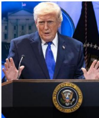
Protezionismo Il presidente Usa, Trump

Anche il mondo agricolo reagisce con favore